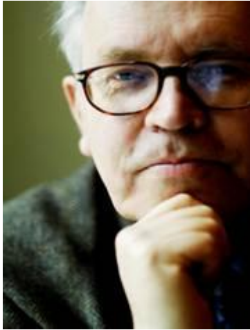
Peter von Bagh

Cercle Francais de Porin toiminta jatkui vilkkaana myös vuonna 2008. Vuosi lähti hienosti liikkeelle, kun saimme itsensä professori Peter von Baghin luennoimaan Poriin. Hän luennoi ranskalaisesta elokuvasta torstaina 31. tammikuuta työväenopiston auditoriossa, joka täyttyi innokkaista kuulijoista. Cercle järjesti tilaisuuden yhteistyössä Porin kaupunginkirjaston ja työväenopiston kanssa.