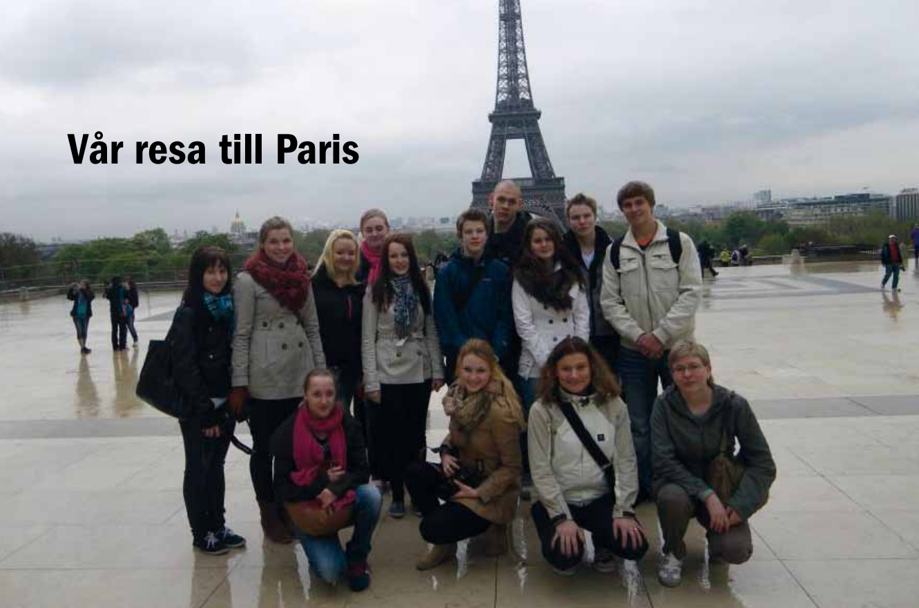
Lovisa Gymnasiums franska studerande i Paris.

Mellan den 19 och den 23 april besökte Lovisa Gymnasiums franska studerande Paris, modets, caféernas och romantikens stad. Det vi såg och lärde oss var unikt och resan kommer att stanna länge i våra minnen.