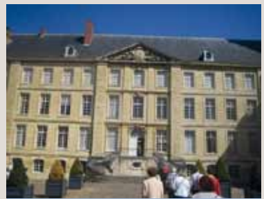
Kuningas Stanislasin linna pikku Versailles Lunévillessä.