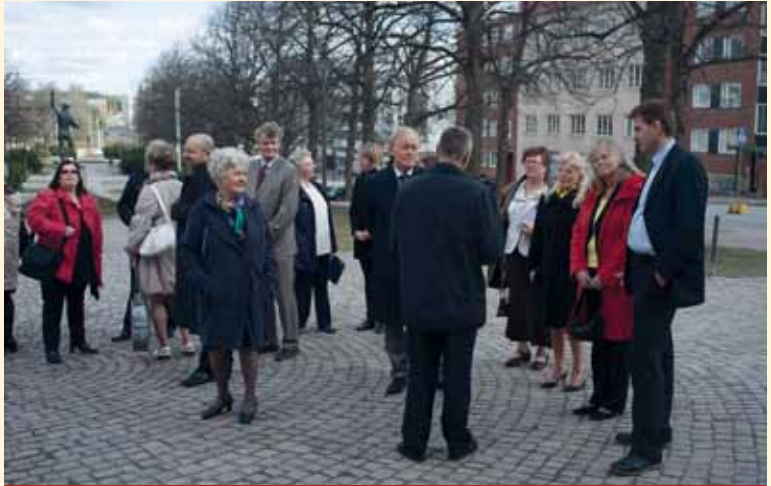
Liittokokousväkeä Lahden kaupungintalolla 28.4.2012.

Lyhyt siirtyminen päivälliselle ravintola Roux'hun ja niin alkoi varsinainen juhla. Me lahtelaiset olimme varanneet ohjelmaksi historiikkia ja