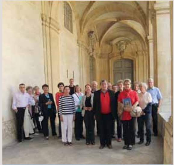
Ryhmäkuva matkalaisista Unescon suojeleman dominikaaniluostarin St.Rémyyn käytävällä Reimsissä.