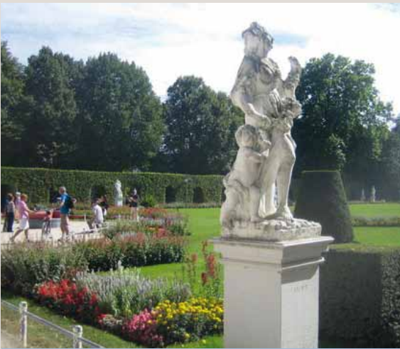
Puistonäkymiä Trieristä.