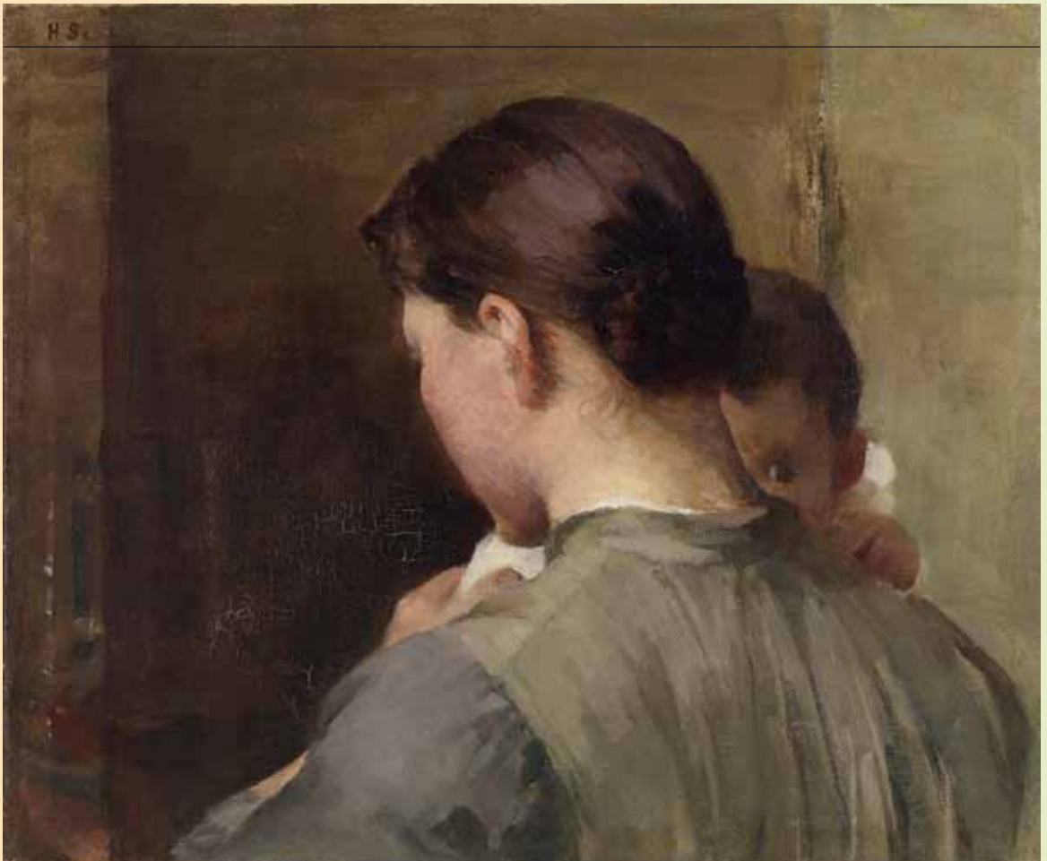
Helene Schjerfbeck: Nainen ja lapsi (n./ca 1887) | Kvinna med barn | Woman with a Child öljy / olja / oil yksityiskokoelma / privatsamling / private collection Maalaus, jonka päälle taiteilija oli ommellut Raaseporin maisema -teoksen kankaan.

retourner en Finlande vu son état de santé fragile et ses difficultés financières. Pour gagner sa vie, Schjerfbeck occupe donc en 1894 un poste de professeur à la Société des beaux-arts à Helsinki. Elle ne retournera jamais en France. En 1902, elle démissionne de son poste de professeur pour cause de maladie et emménage à Hyvinkää. Schjerfbeck y travaille pendant quinze ans, pratiquement sans bouger, tout en lisant les revues d'art internationales. C'est durant cette période que l'artiste développe la peinture qui l'a rendu célèbre, un