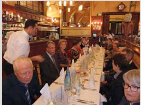
Matkan päätösillallinen nautittiin Art Nouveau-arkkitehtuurin helmessä, Excelsior Floor –ravintolassa Nancyssä.