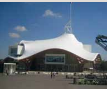
Metzin Pompidou-keskus.