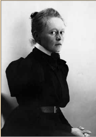
Helene Schjerfbeck, 1890-luvun alku / i början av 1890-talet / in the early 1890s.

La grande rétrospective consacrée à Helene Schjerfbeck au Musée des Beaux-Arts de l'Ateneum jusqu'au 14 octobre fut sans conteste l'exposition à ne pas manquer en cette année 2012. Cette rétrospective célébrant le 150 ème anniversaire de la naissance de Schjerfbeck est à ce jour la plus importante jamais organisée et on ne pouvait imaginer meilleur lieu que l'Ateneum qui en effet possède la plus grande collection au monde de l'artiste. Cette exposition a évidemment présenté les œuvres les plus emblématiques de Schjerfbeck mais également le travail des artistes qui