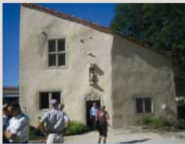
Jeanne d'Arcin syntymäkotona Domrémy-la-Pucellessä.